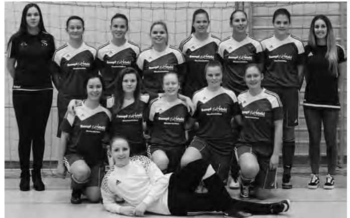
Die Damenmannschaft sorgte für volle Ränge

Der komplette Bericht ist bereits auf der Internetseite "www.SGNellingen.de/Sportbetrieb/Jugendfußball/Aktuelles/" eingestellt.