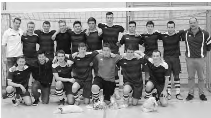
Unsere erfolgreichen A-Junioren

Beim letzten Jugendturnier am Samstag traten die A-Junioren vor vielen Zuschauern, ebenfalls mit zwei Mannschaften, an. Bei spannenden und teilweise emotionalen Spielen belegten unsere Mannschaften den 6. Platz und den 2. Platz. Sie mussten sich lediglich dem Turniersieger aus Westerheim geschlagen geben. Beim Damen-Nachturnier, das um 19:30 Uhr begann, hatten sich dann auch die letzten Plätze auf der Tribüne gefüllt. Die Mannschaften spielten einen sehenswerten und technisch sehr guten Fußball. Zu beobachten war, dass die Mannschaften sehr fair miteinander umgingen. Unsere Damen kämpften um jeden Ball und wurden mit dem 4. Platz belohnt. Ihr bestes Spiel machten sie gegen den späteren Sieger des Turniers, der Mannschaft des Polizeipräsidiums Ulm, die das Turnier ohne Niederlage beendete.