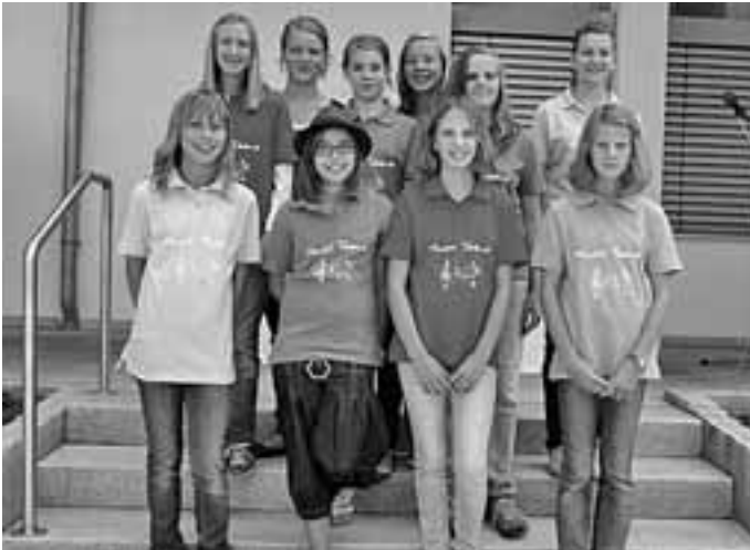
Bunt wie ihre Darbietung: die neuen Poloshirts der Music Teens

Mitglieder des Jugendchores präsentierten in diesem Gottesdienst die neuen Polo-Shirts der Gruppe erstmals in der Öffentlichkeit. Die Anschaffung war durch Spenden (u. a. von der Volksbank Laichingen) möglich geworden.