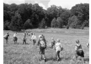
Station 6: Hör- Memory