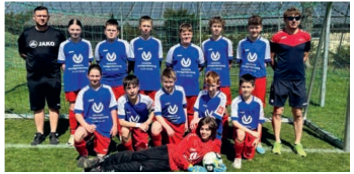
Danke an Armin Weidle, Deutsche Vermögensberatung, für die neuen Trikots