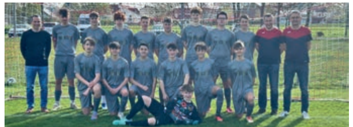
Danke an die Firma Fink Duo für die Trikots